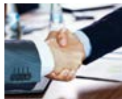
Managed Services in Partnership