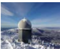
Radar Systems Support