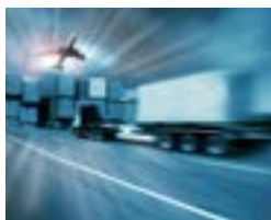
Logistik und Technische Dokumentation