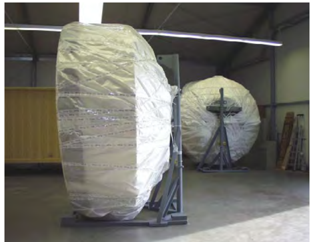
▼ Transportfertige 3 m Antennen