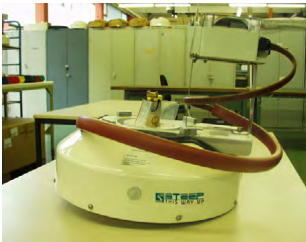
▼ 0,3 m Antenne versandfertig