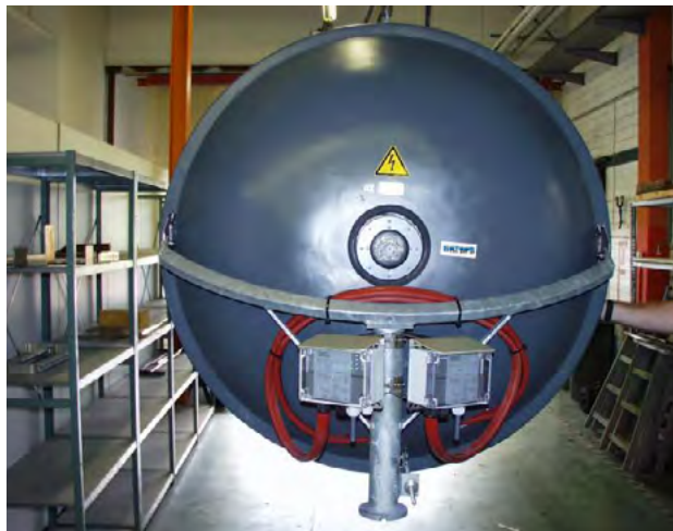
▼ 1,2 m Antenne mit De-Icing-System